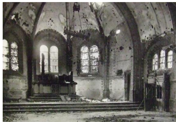
Kapel na de oorlog