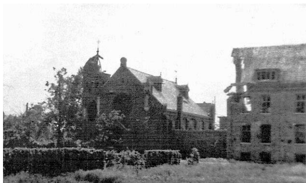
Kapel en school na de beschietingen

Woensdag 27 september ging rustig voorbij. Rustig in de betekenis van zonder grote incidenten. Maar 's nachts om half twee brak plotseling de hel los: het huis werd door de Engelse artillerie vanuit Someren beschoten. Wat een schrik! De oorverdovende knallen van de granaten joegen iedereen op staande voet uit bed. Ruiten rinkelden en vlogen in stukken rond. Nu moet u weten, dat wij achter het huis, vooraan op de sportvelden, schuilkelders hadden gegraven. Het waren wel geen kelders zoals de Duitsers ze bouwden, met metersdikke betonlagen er overheen. Neen, wij hadden alleen lange, diepe kuilen gegraven en die met boomstammen en zand bedekt. Daar moesten allen nu heen. Eerst de kleine jongens en de oude Broeders. Daarna de anderen. Alles verliep wonderlijk rustig en ordelijk. Diezelfde nacht om half vier volgde een tweede beschieting, zwaarder dan de eerste, en om half zeven nog een derde. Om zeven uur was het weer stil. Toen ben ik met Pater Rector eens gaan kijken, hoe het huis er af gekomen was. Treurig! Er was een groot stuk uit de voorgevel geslagen en van de ruiten aan de voorgevel waren er niet veel meer heel. De kapel had ook een voltreffer gekregen, maar de lagere school spande de kroon met grote gaten in de muren. Ik hoorde dat daarin twee soldaten waren gedood; de school was immers hun