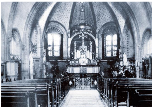
Kapel voor de oorlog