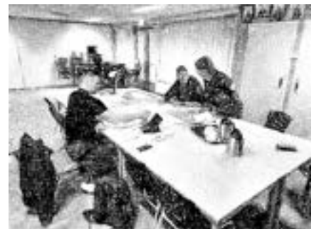
Figuur 1: Vastgoedregisseur Gemeente Leudal met werkgroep 12-2021

Akkoord van Gemeente Leudal om ontwerper in de arm te slaan.