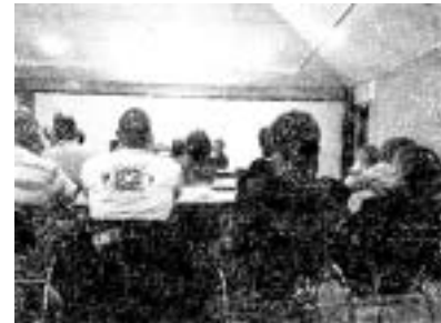
Figuur 3: Informatieavond en omgevingsdialoog Heidegoud 06-2022

https://heibloem.nu/wp-content/uploads/2023/04/Presentatie-Heibloem_VKKL_06-2022.pptx