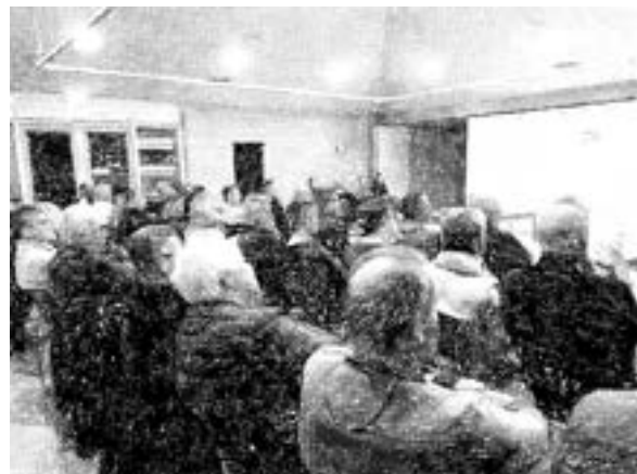
Figuur 5: Informatieavond 03-2023

Informatieavond dorp. Nadat we nog een laatste keer ons ongenoegen hebben geuit over alles wat er gebeurd is met de gemeente de afgelopen jaren, sluiten we dit hoofdstuk af en gaan we kijken naar de toekomst. Hierdoor hebben we de avond met een positieve noot afgesloten en heeft zich een werkgroep gevormd van 8 personen.