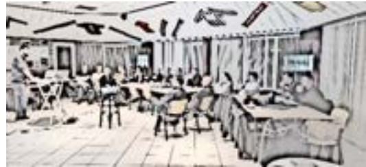
Figuur 9: Werkgroepbijeenkomst 12-2023

Wergroep bestuur/beheer verteld over hun voorstel over hoe zij denken dat het bestuur en beheer eruit zou kunnen zien. Er zitten verschillende mensen in de werkgroep met ervaring op dit vlak en met de werkgroep zijn ze gaan praten bij La Rochelle in Roggel over hoe zij het bestuur en beheer van hun ontmoetingsplek hebben geregeld. Wat gaat er goed bij hun en wat zijn de aandachtspunten.