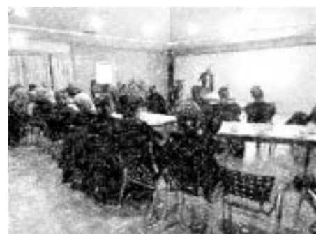
Figuur 4: Dorpsavond 11-2022

https://heibloem.nu/wp-content/uploads/2023/04/20221122-Presentatie-VKKL-Dorpsavond-Inventarisatie-ontmoetingsplek-Heibloem.pdf