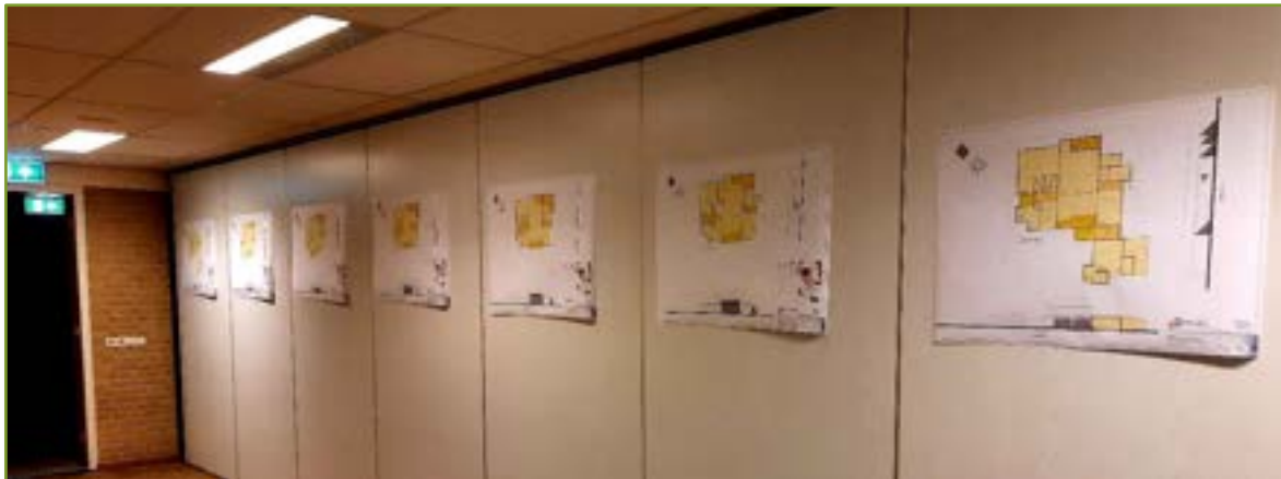
Figuur 2: Eerste schetsen toekomstige Klokkestoel 02-2022

Monogebruik is niet meer haalbaar en de gemeente stelt voor om VkkL in te schakelen als mediation rol tussen bestuur Klokkestoel en de huurders van de Klokkestoel.