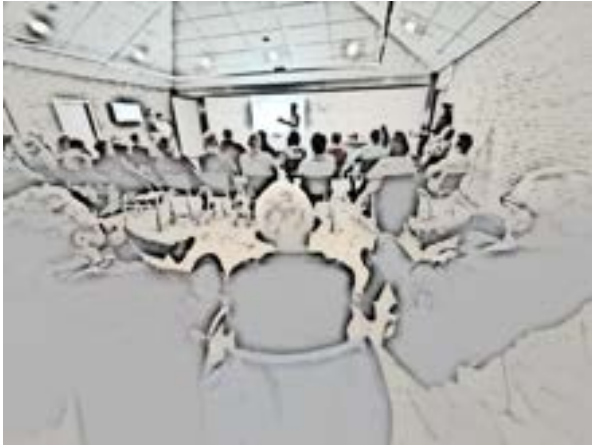
Figuur 15: Bewonersavond en omgevingsdialog 26 februari 2024

De architect heeft de verandering van tekening toegelicht. Belangrijkste: bar is verplaatst waardoor de zaal beter te gebruiken is en er is een doorkijk gemaakt richting achterkant waar de beek ligt en straks ook het spelen en bewegen stukje.