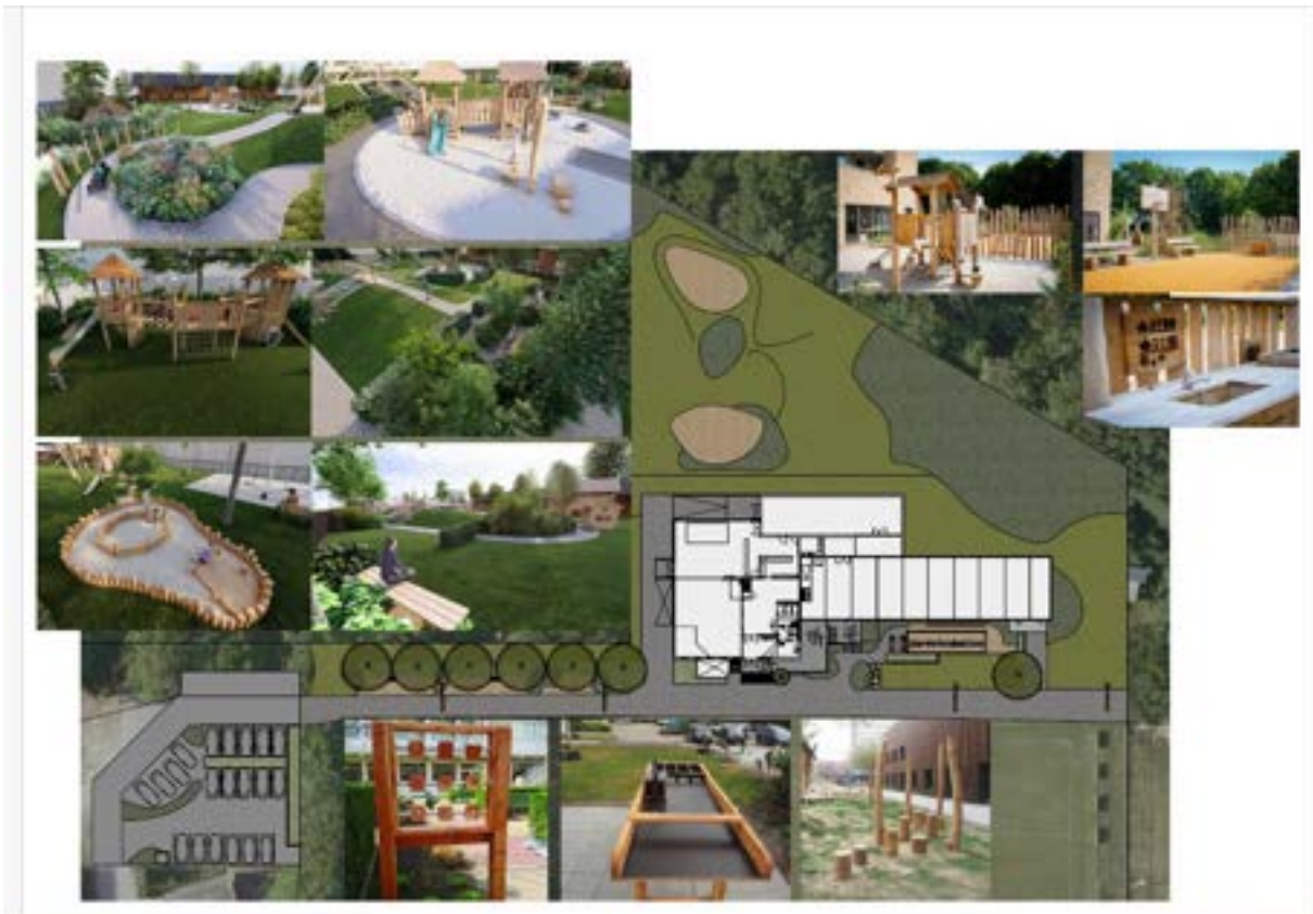
Figuur 16: Sfeerimpressie buitenruimte Van der Asdonk

Die dag van de bewonersavond is om 17:00 een sfeerimpressie van Van der Asdonk gestuurd voor de nieuwe ontmoetingsplek. Die is ook gedeeld met de zaal.