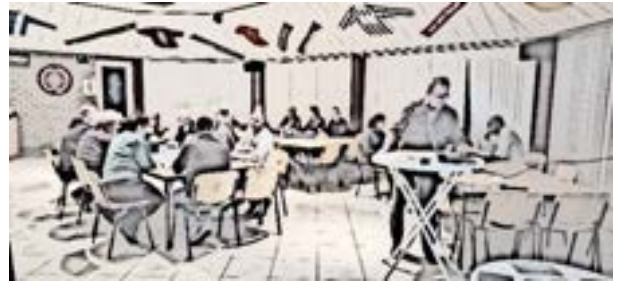
Figuur 10: Omgevingsdialoog 12-2023

Goede opkomst, ruim 16 personen. Er zijn ook verschillende mensen van de werkgroepen aanwezig én iemand die zich wilt inzetten om te komen notuleren. Het is eigenlijk nog heel gezellig ook. Ook hier lopen we aan het begin van de avond tegen het wantrouwen aan richting een gemeente. Deze gevoelens zijn ook terecht als je hoort wat zij in het verleden hebben meegemaakt. Wat we gedaan hebben is zo goed mogelijk het proces geschetst hoe die nu de afgelopen 2,5 verlopen is. En dat alles hand-in-hand gaat met de gemeente Leudal. Garanties heb je nooit, pas totdat je er bent, maar Heibloem staat positief tegenover de samenwerking zoals die nu al enkele jaren verloopt.