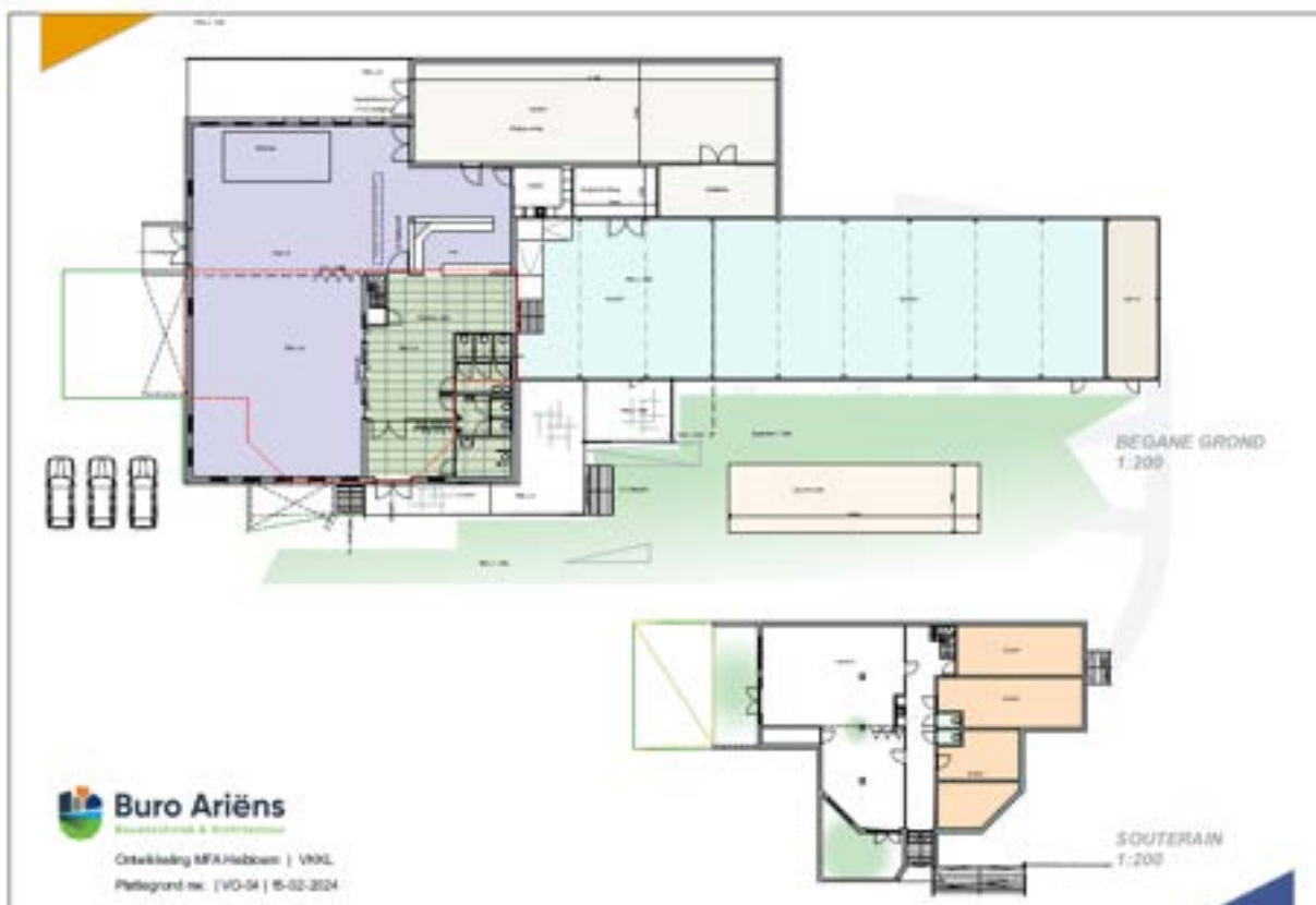
Figuur 14: Definitieve schets architect

Op deze avond is de definitieve schets door de architect toegelicht (nadat er na de laatste bewonersavond wat feedback gegeven was).