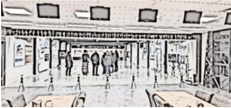
Figuur 13: Commissie sociaal op werkbezoek in Heibloem

In totaal waren 7 commissieleden en wethouder Wijers aanwezig. De werkgroepen kregen een groot compliment van de wethouder over hoe netjes zaken elke week worden aangeleverd en de continuïteit die het proces heeft.