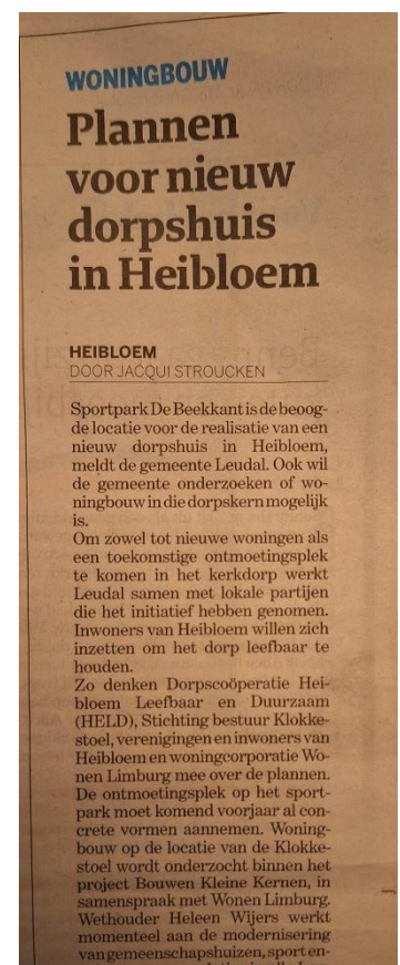
Figuur 8: Krantenartikel toekomst Heibloem