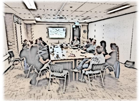
Figuur 7: Kick-off bijeenkomst 09-2023