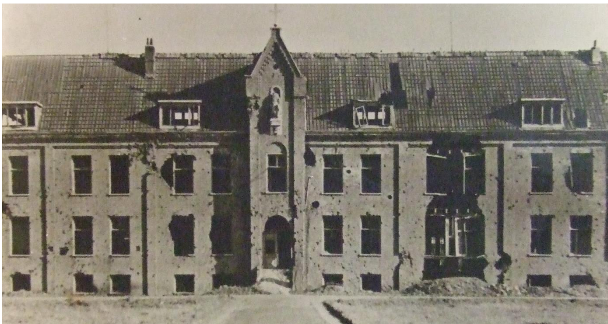
Het hoofdgebouw na de beschieting op 15 november 1944

Diezelfde middag werd er een Engelse piloot door de Duitsers binnengebracht. De man was gewond, had een sleutelbeen gebroken en Broeder Gabriël, onze ziekenbroeder, moest hem verbinden. Overigens werd de man goed behandeld, voor zover wij althans dat konden constateren.