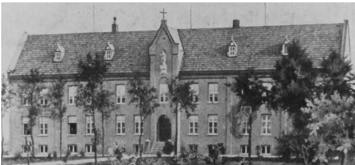
Hoofdgebouw voor de oorlog